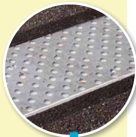
Route de Tané, une dalle podotactile a notamment été mise en place.

L'avenue du Maréchal Lannes a fait l'objet de travaux sur une section de 1,4km. La voie, d'une longueur de 9,380km, est classée dans la voirie d'intérêt communautaire. La CCLG a pris en charge la réalisation de la chaussée : le revêtement routier de caniveau à caniveau avec une largeur de 4,5m dédiée aux véhicules une largeur de 1m pour les cyclistes. La commune de Lectoure a assumé les autres dépenses : le cheminement piétonnier sur une largeur d'1,5m, l'enfouissement des réseaux, l'éclairage public et le réseau pluvial. La bande passante est dégagée de tout obstacle afin d'assurer la continuité du cheminement et permettre son accès aux aveugles et mal voyants. Elle privilégie les déplacements à pied ou en vélo, ce qui réduit les émissions de CO 2 . Ainsi ces aménagements sont profitables à tous.