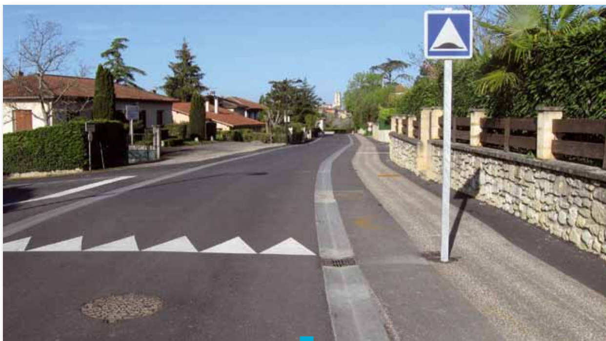
Les premiers aménagements Route de Tané, à Lectoure.

En application de la loi du 11 février 2005 pour l'égalité des droits et des chances, la participation et la citoyenneté des personnes handicapées, les collectivités mettent en œuvre des solutions pour rendre l'espace public plus accessible.