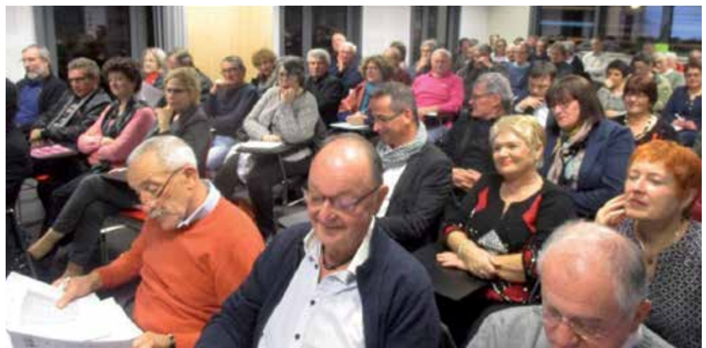
Réunion du Conseil de communauté

Retrouvez le rapport du Débat d'Orientations Budgétaires (DOB) sur notre site : www.lomagne-gersoise.com/Documents-administratifs