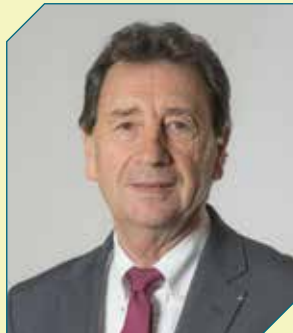
Raymond VALL Sénateur-Maire de Fleurance, délégué au projet de territoire, à la contractualisation et à la coopération